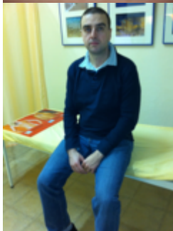
E.R. , Gewichtsreduktion: 30 kg