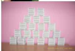
Evelin, Gewichtsreduktion: 100 Stück Butter